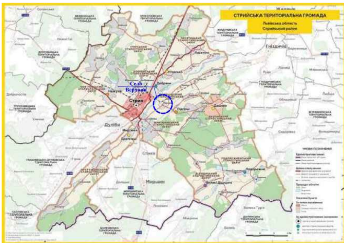
Додаток 1. Схема розташування села Верчани в межах Стрийської міської ТГ