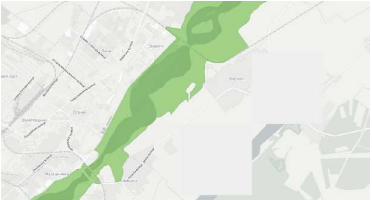
Мал.1 Веб-додаток з бази даних Смарагдової мережі України

Територія села Верчани з північної сторони знаходиться в зоні Смарагдової мережі – прийняті території Постійним Комітетом Бернської конвенції (колір салатовий). Межі прийнятої території Смарагдової мережі відносно населеного пункту показано на Мал.4.