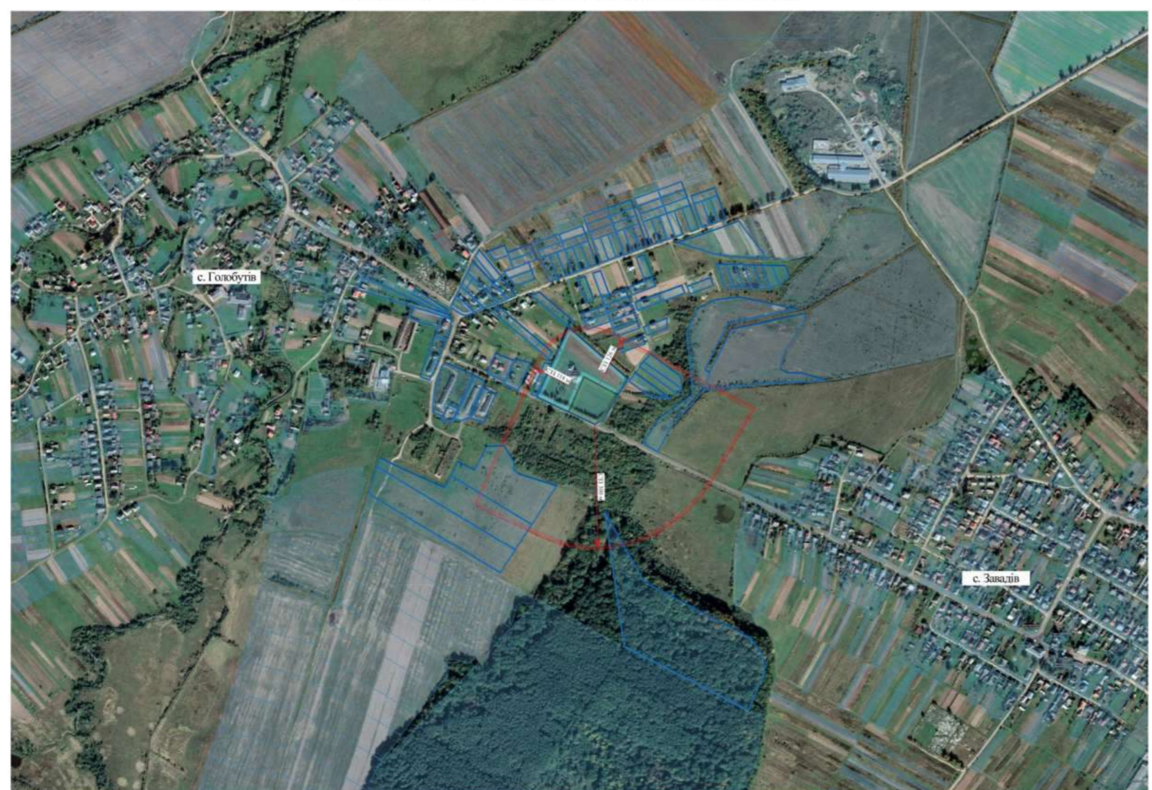
СХЕМА РОЗМІЩЕННЯ ПРОЕКТОВАНОГО КЛАДОВИЩА З НАНЕСЕНИМИ НОРМАТИВНИМИ РОЗМІРАМИ